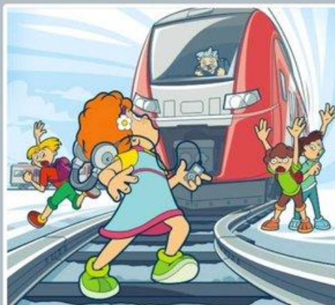
Плеер и железная дорога — несовместимы!