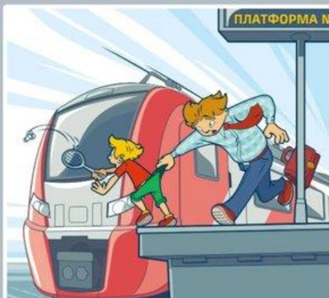
Платформа — не место для игр!