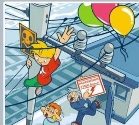
Приближаться к проводам меньше чем на 2 метра — смертельно опасно!