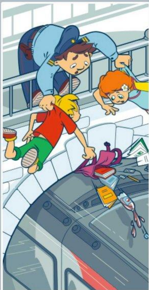
Проезд на крышах и подножках поездов — может стоить жизни!