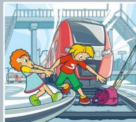
Нельзя переходить пути в неполюженном месте!